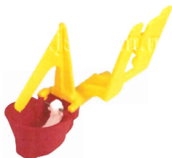
Bebadero automático de iniciación en Jaula