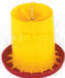
Comedero de Tolva de 11 kg.