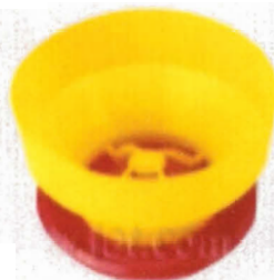
Comedero de pre inicio