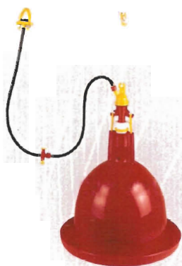
Abastecedor de agua para aves

Además: ACCESORIOS Y EQUIPOS PARA GRANJAS DE POLLOS