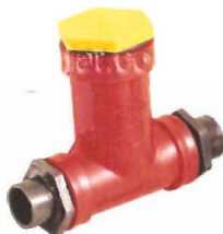
Filtro para Aves