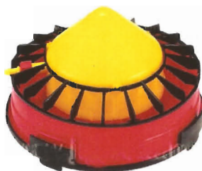
Bebadero automático de iniciación en piso